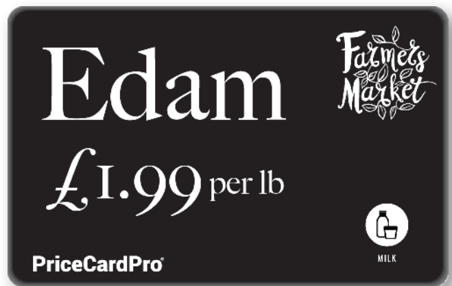
86 x 54 mm, schwarze Karte, weiße einfarbige Farbfolie.