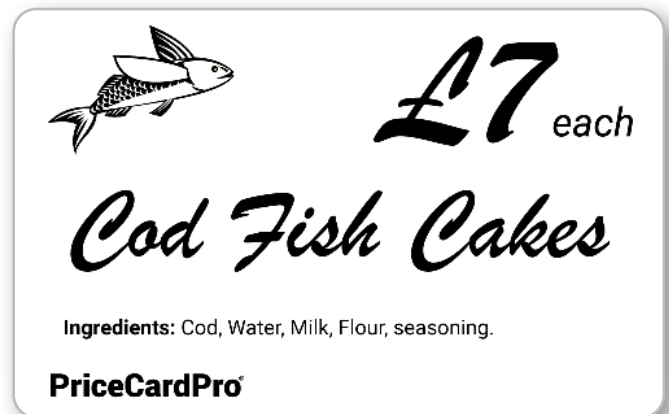
86 x 54 mm, weiße Karte, schwarzer einfarbiger Farbfilm.