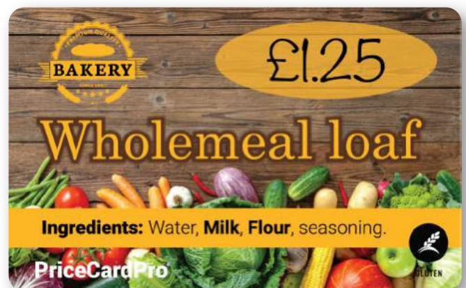
86 x 54 mm, weiße Karte, vollfarbige YMCKO-Farbfolie.

Seit dem Beitritt zu diesem Programm hat Magicard 30.000 Bäume gepflanzt, was zu einem potenziellen CO 2 -Ausgleich von 660 Tonnen pro Jahr führt. Dies entspricht der jährlichen Fahrleistung von 150 Autos oder jeder Fahrt, die von den Magicard-Mitarbeitern weltweit sowohl für private als auch für berufliche Zwecke unternommen wird, sowie einem beträchtlichen Teil unserer weltweiten Bodentransporte für Produkte.